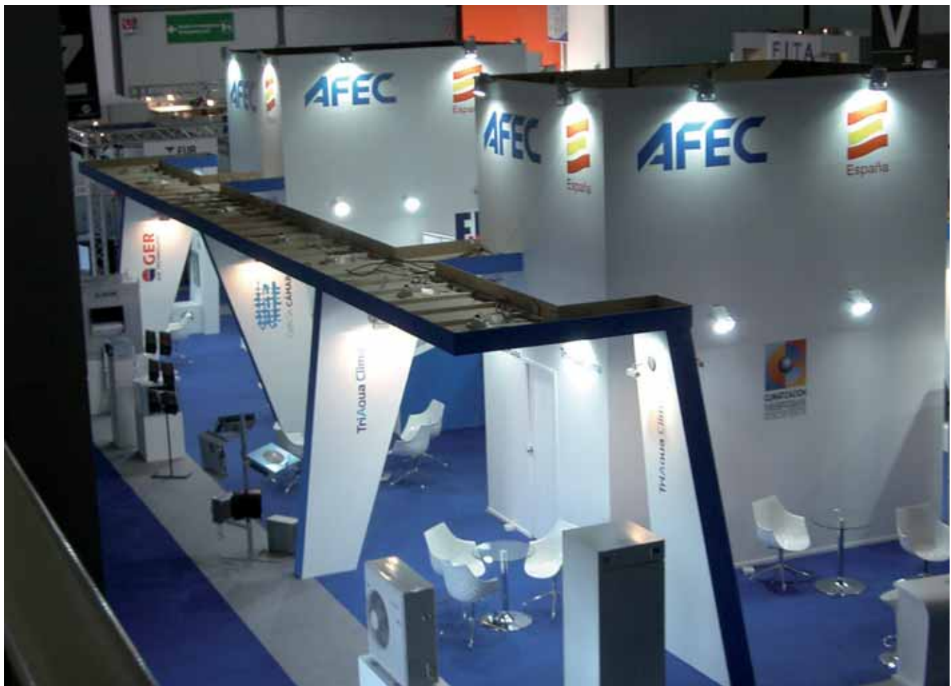
Vista cenital del stand de AFEC en MOSTRA CONVEGNO 08

Aunque este documento no ha sido cumplimentado aún por las empresas y por lo tanto desconocemos el detalle de los datos anteriormente citados y la opinión definitiva de las empresas respecto de su presencia en la feria, la percepción general, durante la celebración del certamen y a su terminación, era de satisfacción por la cantidad y sobre todo por la calidad de los visitantes.