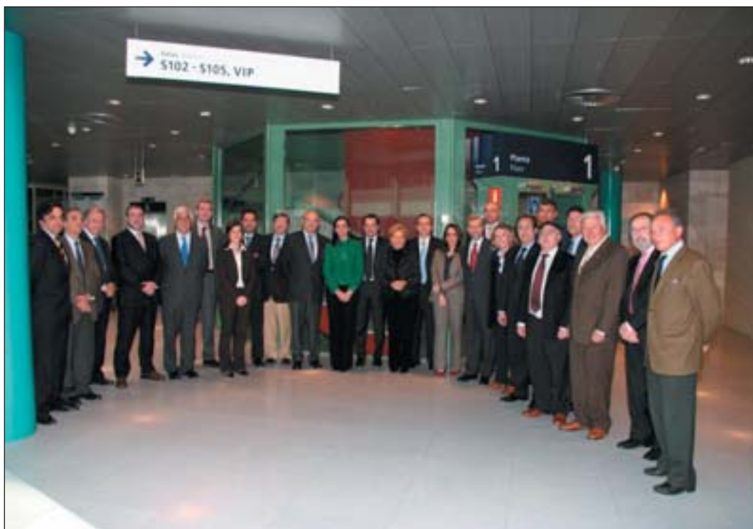
Comité Organizador de CLIMATIZACIÓN 07.

Algunos de los miembros presentes realizaron sugerencias sobre diferentes aspectos generales del Salón que fueron recogidas para su análisis en las respectivas comisiones. Entre ellas destacan las relativas a incentivar las visitas procedentes de aquellas autonomías, no suficientemente representadas desde el punto de vista de la demanda.