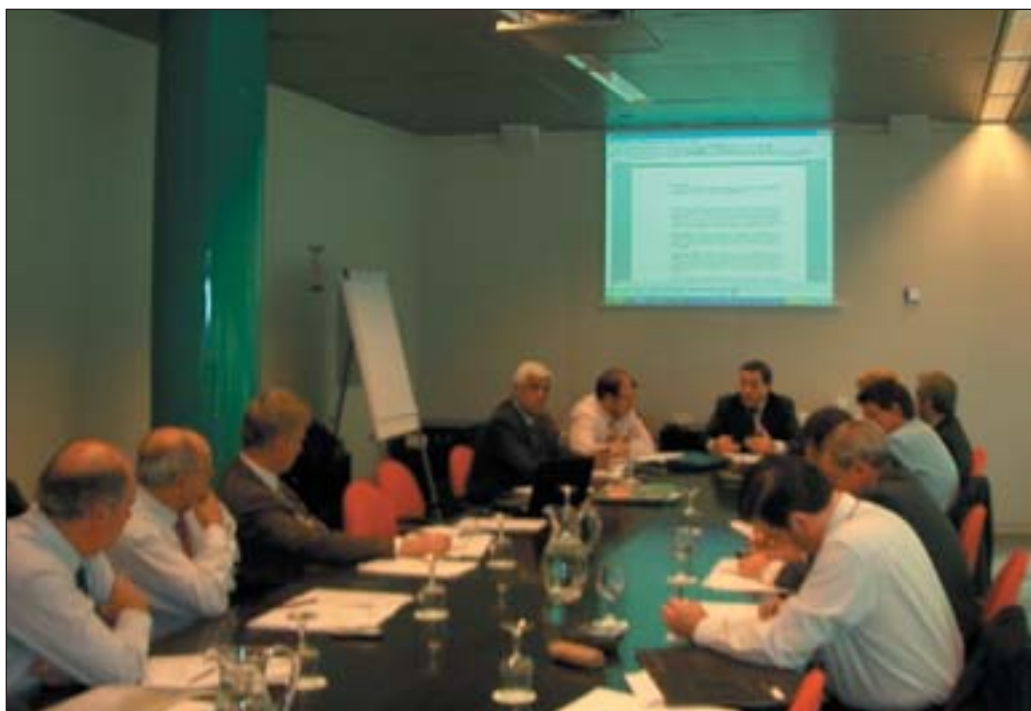
Junta Directiva de AFEC. Reunión del 7 de febrero de 2006.

La Junta Directiva, a propuesta del tesorero, aprobó de forma provisional, la aprobación definitiva corresponde a la asamblea general, las cuentas correspondientes al cierre del ejercicio 2005, de AFEC y SERVIAFEC. El ligero superávit obtenido se aplicará a la financiación de nuevas actividades entre las que destaca el Plan de Comunicación, que se decidió desarrollar a lo largo de los próximos meses, y cuyo desarrollo podría tener que realizarse en varios ejercicios. Una breve reseña de este Plan y de los objetivos que se pretenden con el mismo se realiza en la sección correspondiente de este boletín.