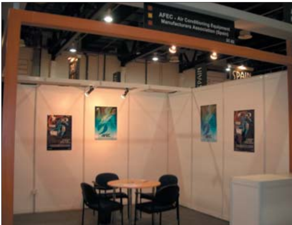
Stand de AFEC en BIG 5 SHOW.

Correspondiendo a esa demanda se realizó la entrega, en el stand, de un gran número de folletos, en español, árabe e inglés editados específicamente para la feria.